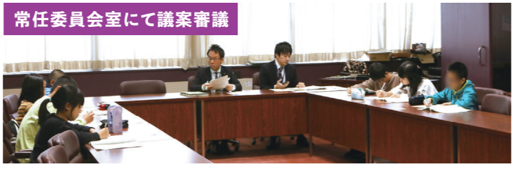
常任委員会室にて議案審議

本会議場で開催する特別授業に参加したのは、日佐小・月隈小・春吉小・那珂南小・柏原小の5校、合計380人で、市長役の議員から提案される「朝食も給食としてはどうか?」や「中学校の制服をなくしてはどうか?」「公園のゴミ箱を撤去したい」という議案について、熱心に議論し賛成・反対の意見を交わしました。1日議員体験などを通じて、市議会や行政を身近に感じていただければと思います。