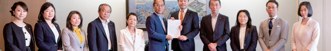
私たち「福岡市民クラブ」は、市民の代表である議会の立場から、とりわけ最も市民生活に近い会派として、新型コロナウイルス感染症の影響により生じた環境を一日も早く打開し、元気なまち福岡を取り戻すべく、要望・提言を提出しました。(写真は、第4回光山副市長に手交)